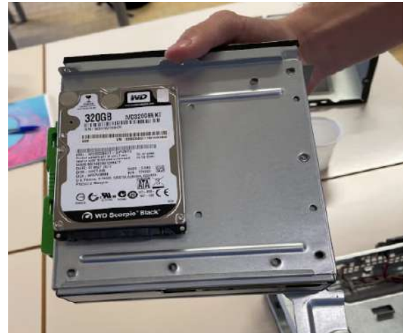
HDD 320GB WD3200BEKT

Il terzo componente che abbiamo rimosso è la CPU (Central Process Unit) o anche chiamato processore, esso è stato rimosso dopo aver svitato il dissipatore e aver aperto il socket dove era contenuta con annessa pulizia con alcool isopropilico per rimuovere la pasta termica (essa serve per evitare un eccessivo surriscaldamento della CPU ).