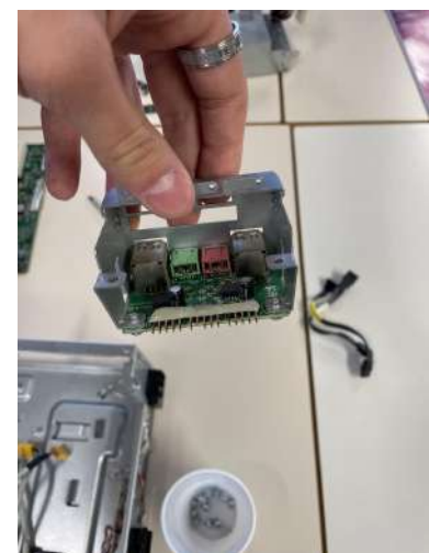
interno di una porta USB